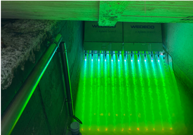
Bild 4: Auf dem Klärwerk Steinhof wird das ECOPLAS-Messsystem in unmittelbarer Nähe der UV-Desinfektion installiert.